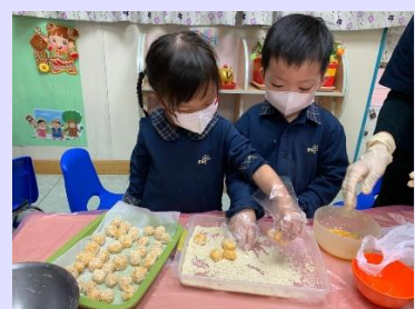
製作賀年食品笑口棗