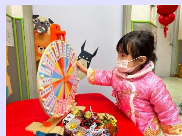
認識新年祝賀句子