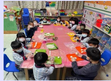
製作美食黃金碌碌