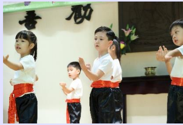
中國功夫舞蹈表演