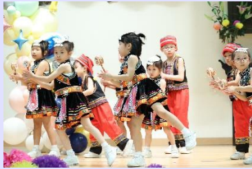
中國少數民族搖鼓舞表演